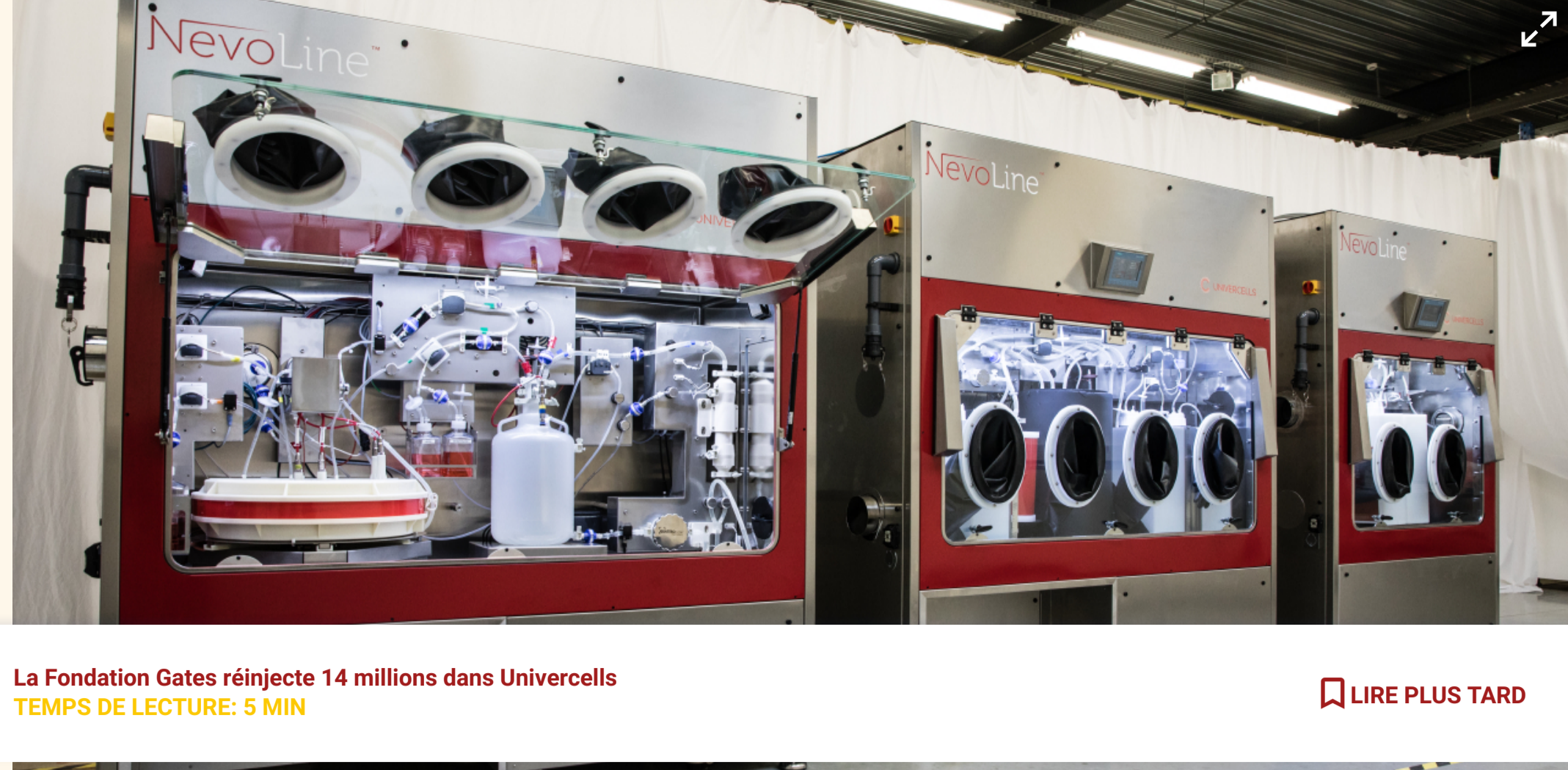
La Fondation Gates réinjecte 14 millions dans Univercells TEMPS DE LECTURE: 5 MIN